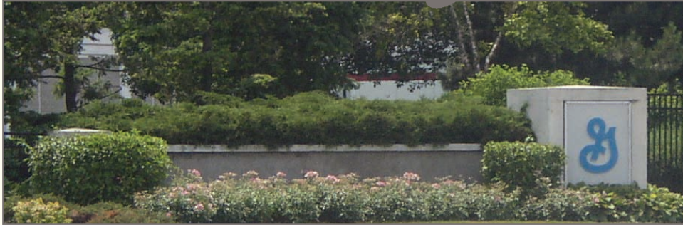
General Mills ahora

Por cinco décadas, los residentes de West Chicago han compartido en el olor dulce del éxito de General Mills, una corporación americana icónica que llegó en 1959 con una misión de producir productos de calidad para alimentar las familias del mundo. La comunidad ha cosechado ventaja de la fabricación central eléctrica, que ha servido como un motor económico y modelo de ciudadano corporativo.