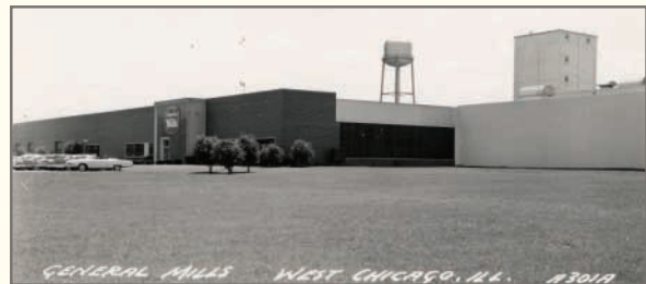
General Mills, circa 1960

Para una mirada retrospectiva de General Mills a través de las décadas, visite www.westchicago.org bajo Business/Marketplace Milestones.