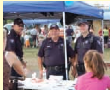
Nacional Night Out 2009

La Ciudad de West Chicago participará con las vecindades por toda la nación el martes, 3 de agosto de 2010 , en ser anfitrión de su propio Nacional Night Out. El evento es una tradición anual que celebra el éxito de comunidades contra el crimen, programas de prevención de droga y violencia.